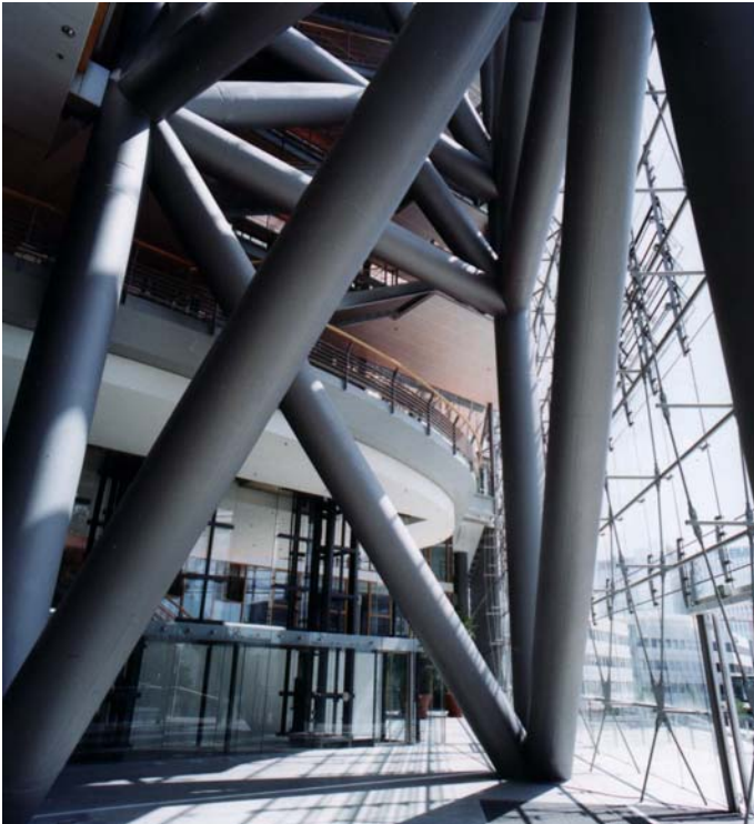
Abbildung 4. Aus Hohlprofilen hergestellte Fachwerkürme

Die technische Grundlage der Brandschutzberechnungen war der Eurocode 4, Teil 1-2.