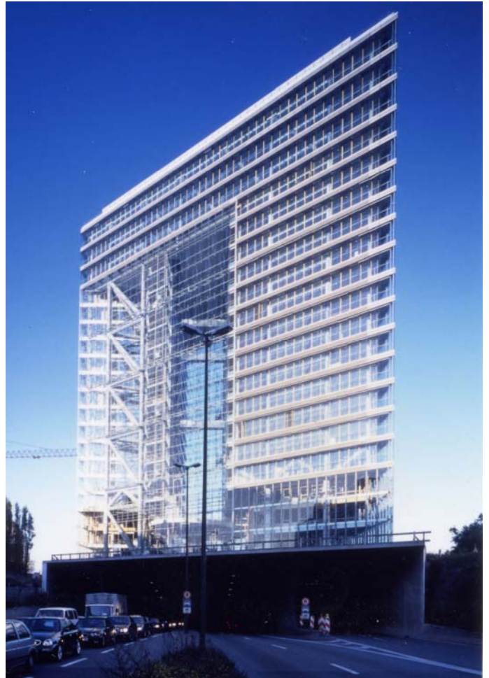
Abbildung 1. Stadttor Düsseldorf

Gründung auf den Tunnelwänden des Rheinuferstrassentunnels